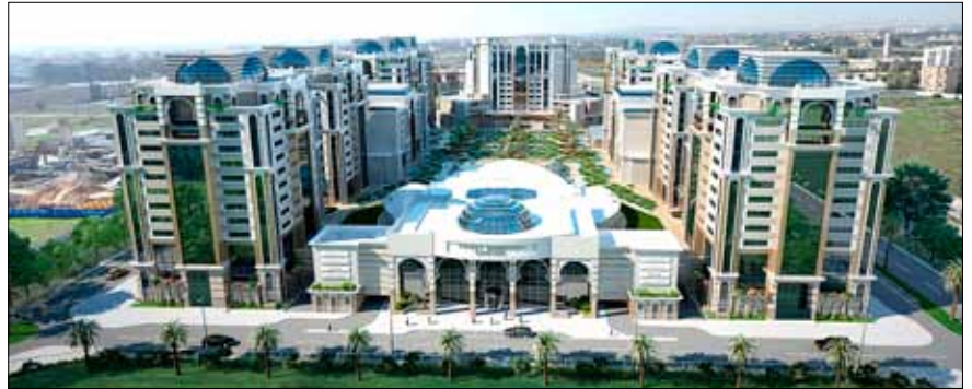
Complexe TRUST BAB EZZOUAR